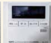
自動追炊・湯はり付