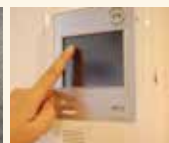
モニタ付きインターホン