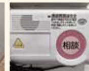
相談ボタン付通話機