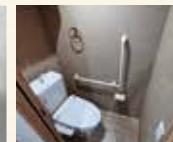
ウォッシュレットトイレ