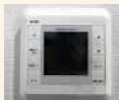
リビングルーム床暖房